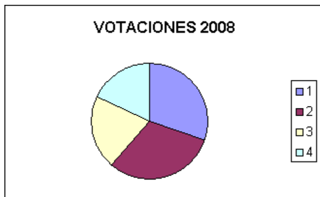
Figura 2: Gráficos estadísticos en Excel usando distintos formatos